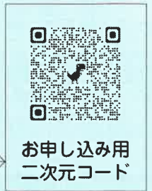
お申し込み用 二次元コード